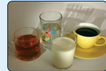
Water, koffie (zonder suiker) en gewone thee (zonder suiker) en melk zijn niet zuur

Beperk het gebruik van zure dranken en zuur voedsel. Neem als alternatief zo mogelijk water, gewone thee (zonder suiker), dus géén vruchten- of kruidenthee, koffie (zonder suiker) of melk. Houd zure producten zo kort mogelijk in uw mond. Spoel de drank dus niet rond in uw mond. Zuig ook niet op zuur snoep of andere zure producten. Beperk het aantal keren dat u eet of drinkt. Gebruik drie maaltijden per dag en daarnaast niet meer dan vier keer iets tussendoor. Eet maximaal een- of tweemaal per dag zuur fruit. Als u bij uw eten drinkt, geldt dat als één moment.