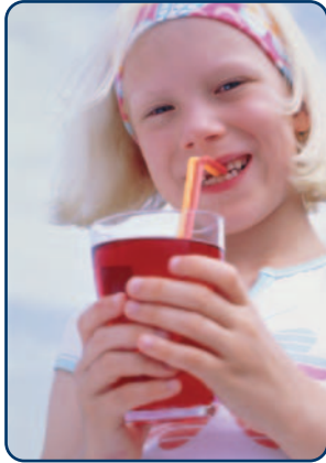
Er worden vaker en meer fris- en sportdranken gedronken

Gaatjes (tandcariës) worden veroorzaakt door bacteriën in de mond. Deze mondbacteriën vormen zuur uit suikers en andere koolhydraten (zoals in bijvoorbeeld pasta, aardappelen en brood). Dit zuur veroorzaakt tandcariës. Tanderosie is slijtage van het tandglazuur door zuren uit eten en drinken of uit de maag. De laatste jaren zijn de voedingsgewoonten ingrijpend veranderd. Zo worden vaker en meer fris- en sportdranken gedronken. Dat heeft tanderosie tot gevolg. In deze folder leest u hoe u tanderosie kunt voorkómen.