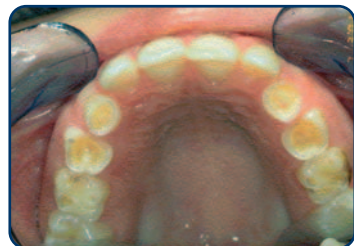
Tanderosie bij een kind van 8 jaar

Meestal merkt u tanderosie pas op in een vergevorderd stadium. Als u klachten krijgt bij het eten of drinken bijvoorbeeld. Vaak is het tandglazuur dan al verdwenen. Tanderosie kunt u pas herkennen als het uiterlijk van de tanden verandert. De voortanden worden korter, dunner en doorschijnender of krijgen rafelige randen. De tanden worden (plaatselijk) steeds geler of de tanden krijgen donkere plekken. Het glazuur wordt namelijk