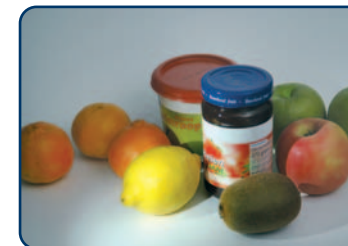
Alle zure voedingsmiddelen kunnen schadelijk zijn

Alle zure voedingsmiddelen, hoe gezond ook, kunnen schadelijk zijn voor uw gebit. Vooral voor zuur fruit moet u oppassen. Denk aan citrusvruchten, bramen en bessen, appels, druiven, kiwi's en mango's, maar ook aan de producten daarvan (appelstroop, jam, vruchtensap). Ook alle levensmiddelen die zijn aanzuurd met bijvoorbeeld azijn- of citroenzuur, veroorzaken bij veelvuldig gebruik tanderosie. Denk aan bijvoorbeeld slasaus of mayonaise. Veel mensen zuigen op vitamine C tabletten in plaats van ze direct door te slikken. Dat kan funest zijn voor de tanden. Vitamine C producten zijn van zichzelf al licht zuur en bovendien zijn ze nog eens op smaak gebracht door toevoegingen van een zoetstof en citroenzuur.