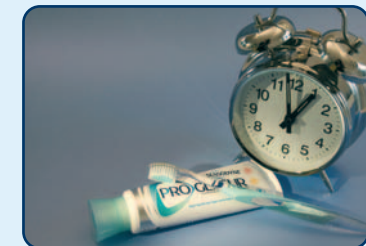
Gebruik geen zure producten één uur voor het tandenpoetsen

Poets tweemaal per dag uw tanden. Gebruik een zachte tandenborstel en een fluoridetandpasta. Reinig de ruimte tussen de tanden en kiezen eenmaal per dag met ragers, flossdraad of tandenstokers. Eet of drink één uur voordat u uw tanden gaat poetsen géén zure producten. Het oppervlak van tanden en kiezen wordt zachter door de inwerking van zuur. Als u direct na het eten of drinken van zuur uw tanden poetst, kunt u de glazuurlaag gemakkelijk wegpoetsen.