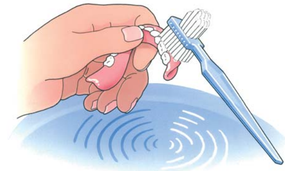
Reinig uw kunstgebit na iedere maaltijd

Uw kunstgebit is nu nog nieuw en mooi. Dat wilt u natuurlijk graag zo houden. Daarom moet u, net als bij eigen tanden en kiezen, uw kunstgebit verzorgen. Als u het niet regelmatig schoonmaakt, blijven er voedselresten achter. Zowel op uw kunstgebit als eronder. Als u die niet verwijdert, kan uw tandvlees op den duur gaan ontsteken. Reinig uw gebit daarom zorgvuldig na iedere maaltijd. Gebruik een speciale protheseborstel, bijvoorbeeld van Lactona of Oral-B, en water om etenresten goed te verwijderen. Gebruik géén tandpasta. Die kan te veel schuren. Een schoon kunstgebit voelt altijd glad aan. Laat uw gladde gebit tijdens het reinigen niet uit uw handen glippen. Het zal kapot gaan. Vul voor de zekerheid eerst de wasbak met water en reinig uw gebit daarboven.