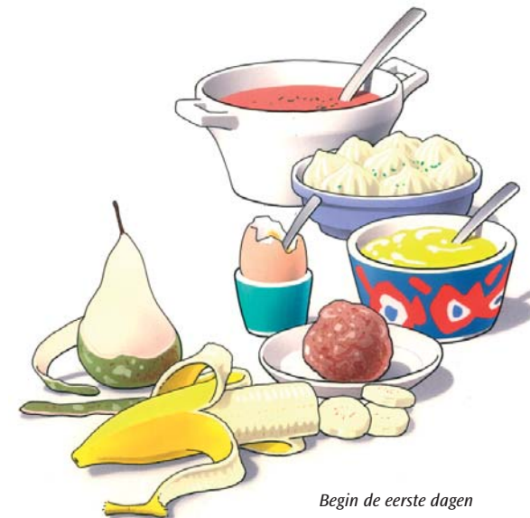
Begin de eerste dagen met zacht voedsel

Eten met uw nieuwe kunstgebit is wat onwennig. Zeker in het begin zult u voorzichtig aan doen. U ervaart zelf het beste wat wel en niet kan. Neem de eerste dagen zacht voedsel, zoals puree, gehakt en zacht fruit. Probeer enkele dagen daarna een stukje vis en een aardappel. Weer later kunt u voedsel eten zoals vlees of een appel. Stukken afbijten kunt u met een kunstgebit beter niet doen. Snijd uw voedsel daarom in stukjes en kauw rustig en gelijkmatig met uw nieuwe kunstkiezen. Neem daarbij aan beide zijden een stukje voedsel in de mond. Neem er iets meer tijd voor dan dat u gewend was.