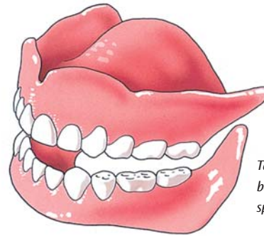
Tanden en kiezen zijn belangrijk voor het kauwen, spreken en het uiterlijk

Als u in de spiegel kijkt, moet u waarschijnlijk erg wennen. Uw mond is nu eenmaal een belangrijke blikvanger en die is veranderd. Neem een paar dagen de tijd om te wennen en beoordeel pas dan hoe u er met uw nieuwe tanden en kiezen uitziet.