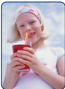
Er worden vaker en meer fris- en sportdranken gedronken

Alle kinderen zijn er gek op: snoep en frisdrank. Alle ouders weten wel dat je van snoepen gaatjes krijgt. Er zit namelijk veel suiker in. Veel minder ouders weten dat in veel zoete producten ook zuren zijn verwerkt. Je proeft ze niet, want de zoete smaak overheerst. Maar die toegevoegde zuren in voeding en dranken veroorzaken wel een ander probleem voor het kindergebit: tanderosie. Het tandglazuur van de nieuwe blijvende tanden van uw kind is nog niet volledig uitgehard. Daarom is het kindergebit extra kwetsbaar voor zuren.