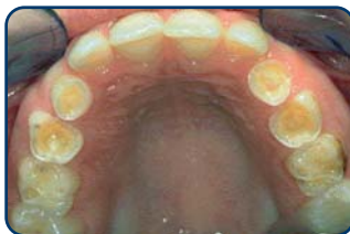
Tanderosie bij een kind van 8 jaar

Tanderosie ziet u pas in een vergevorderd stadium. Als het uiterlijk van de tanden of kiezen verandert. Te laat dus. Gelukkig kan de tandarts of mondhygiënist het eerder ontdekken. Door tanderosie kunnen de voortanden korter en dunner worden (dus kwetsbaarder voor breuk) of ze krijgen doorschijnende en rafelige randen. Verder kunnen de tanden plaatselijk steeds geler worden of donkere plekken krijgen. Het glazuur wordt namelijk dunner en het onderliggende gele tandbeen schijnt er dan doorheen. In de knobbels van de kiezen kunnen putjes ontstaan. In een later stadium kunnen de knobbels van de kiezen zelfs helemaal verdwijnen. Dan kauwt uw kind dus op het tandbeen. Dat geeft pijnklachten en gevoeligheid.