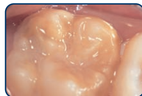
Een kaaskies in een blijvend gebit