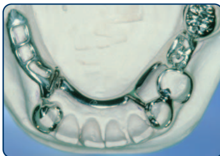
Frameprothese in wording op een gipsmodel, zonder kunsttanden en -kiezen

soort slotje. Bij een slotje wordt de ene kant vastgemaakt aan een kroon, tand of kies en de andere kant zit vast aan de frameprothese. De frameprothese kunt u op die manier in het slotje schuiven. Het slotje zit doorgaans aan de binnenkant van de tanden en kiezen en is dus niet vanaf de buitenkant zichtbaar. Ankertjes zijn vaak wel enigszins zichtbaar.