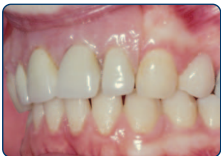
Plaatprothese van opzij