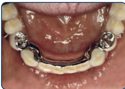
Frameprothese met verankering op kronen