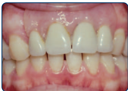
Plaatprothese van voren

De plaatprothese is gemaakt van een roze, tandvleeskleurige kunsthars. Daarin zijn de kunsttanden en -kiezen verankerd. De gehele plaatprothese rust op het slijmvlies van de mond. Deze zit eventueel met ankertjes vast aan overgebleven tanden of kiezen.